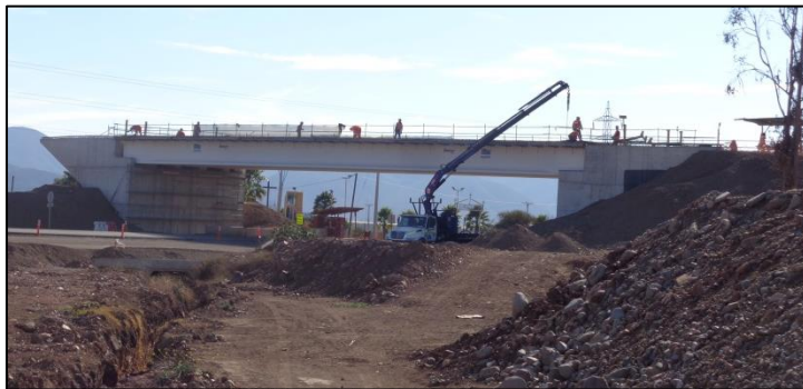
Enlace EL Peñón

Tramo 4: Avenida Las Torres se ejecutará calzada simple entre Av. La Cantero y Av. Balmaceda.