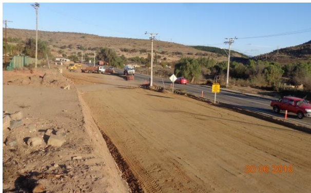
Imagen N°04. Trabajos Sector Recoleta