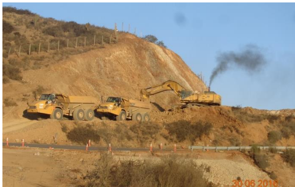
Imagen N°02 Trabajos de Corte Las Cardas