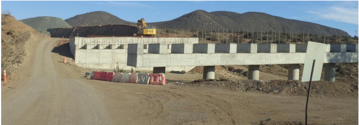
Imagen N°01. Puente La Laguna , Cepa central