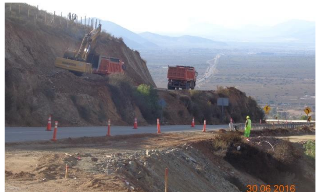
Imagen N°03 Trabajos de Corte Las Cardas