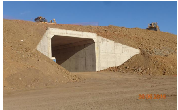
Imagen N°05. Atravesio El Totoral